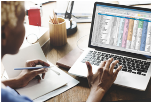
"חלה חובה על כל סוכן להשלים את חובותיו הנוגעות לתשלום דמי חבר השנתיים"

"להזכירם, לפני כחודש ביקשה ועדת התקנון, בהתאם להנחיית בית הדין, להביא להצבעה באסיפה הכללית של כלל חברי הלשכה שינויים בתקנון הנוגעים, בין היתר, למתן הנחות בדמי החבר. עקב התנגדות של גורמים מסוימים אשר הובילו קמפיין בקריאה לביטול ההצבעה, מבלי להבין את מהות