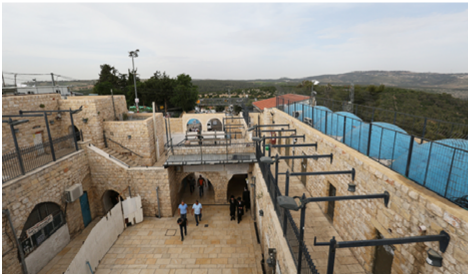
מתחם קבר רבי שמעון בר יוחאי בהר מירון