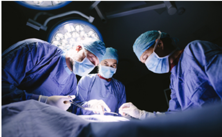
פוליסת הבריאות החדשה אינה כוללת החזר של הקופה בגין ניתוח ימי אשפוז

חברת הביטוח הוסיפה כי חוק ההסדרים עשה רפורמה בפוליסת הבריאות הן של קופות החולים והן של חברות הביטוח והפוליסה החדשה שברשות המבוטח, להבדיל מהישנה, כפופה לחוק זה.