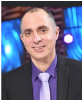
תדהר סאטובי

הפירוש מבאר כי הקשר ביניהם היה קשר אהבה כה חזק עד כי בכל מקום אליו הלך יצחק הוא ציין בגאווה את היותו בנו של אברהם, כילד המעריץ את אביו, ובכל מקום בו פסע אברהם הוא אמר בגאווה אף הוא: אני אביו של יצחק, כאב המתגאה בהצלחת בנו.