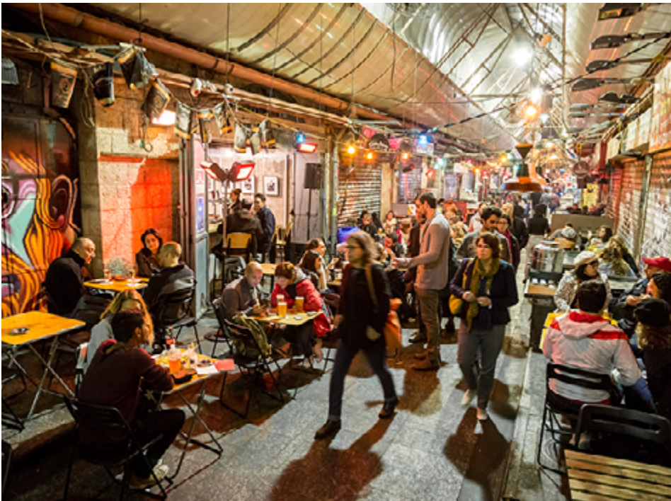
משתתפי הכנס יהוו מספור טעימות בשוק מחנה יהודה.

פיני חג'ג': "הכנס בירושלים מיועד להרים את המורל והמוטיבציה. צריך לטפל ברוח בתקופה זו" • הכנס צפוי להערך ב-15-16 ביוני בירושלים < רונית מורגנשטרן